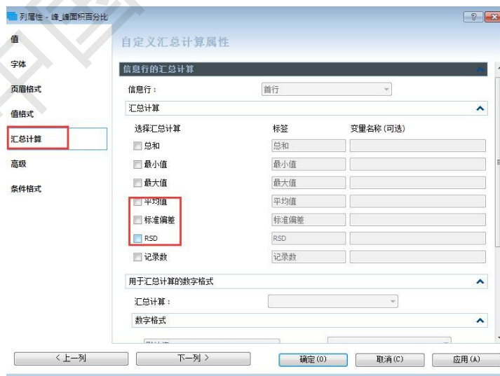
图 7 加入汇总计算