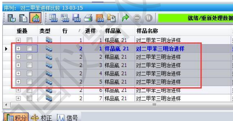
图 1 选中数据

再点击图 1 中绿色小剪头做数据再处理。然后先选中几个数据, 再在报告版面界面, 新建报告模板。设置报告类型为单个序列总结;