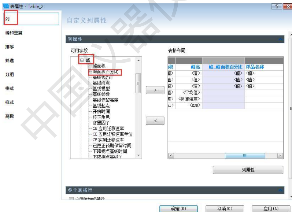
图4 加入峰面积百分比