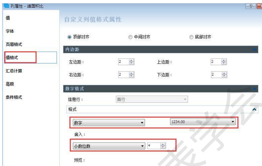
图 8 设置数据格式