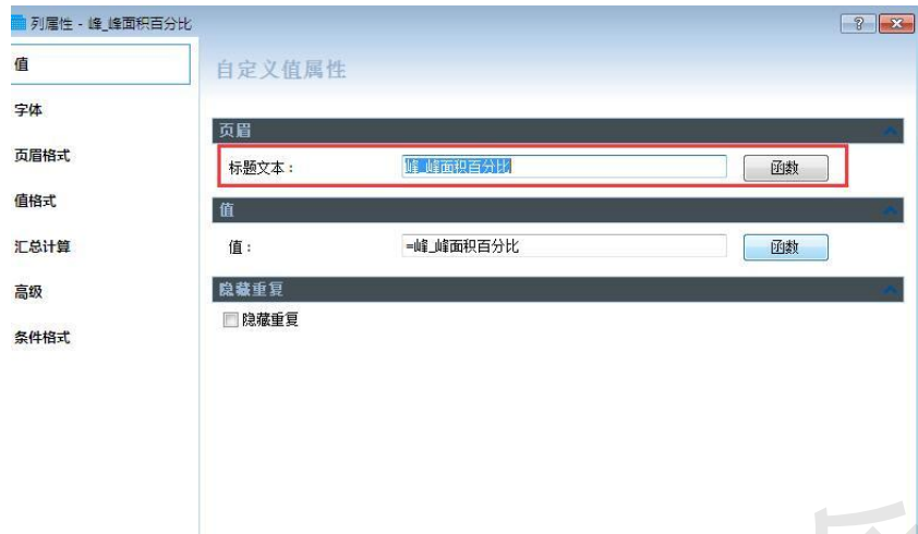
图 5 修改列标题名称