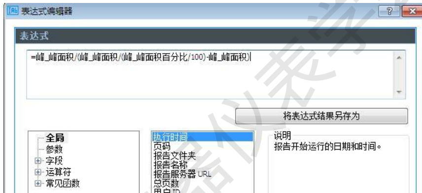
图 6 修改函数