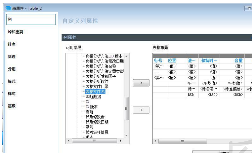
图 10 加入数据文件名