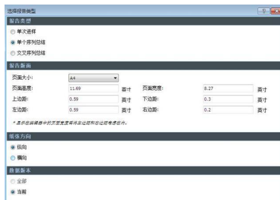
图 2 新建模板